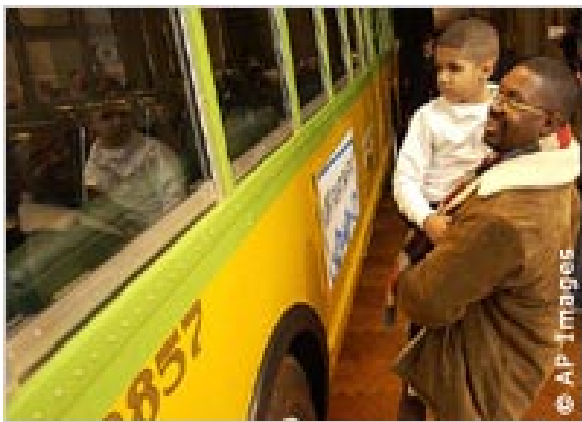
Un hombre y su hijo observan el autobús en que Rosa Parks rehusó ceder su asiento en Montgomery, Alabama, en 1955