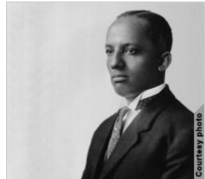
Carter G. Woodson, fundador del Mes de la Historia Afroestadounidense