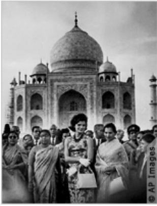
Jacqueline Kennedy en su visita al Taj Mahal en Agra (India), en 1962.

Estados Unidos, Martha Washington (1789-1797) fue tratada por la élite de Nueva York y Filadelfia, primeras capitales del país, como "dama" de la corte real británica. En público era conocida como "Lady Washington", el popular apodo que se había ganado durante los tiempos de la guerra revolucionaria.