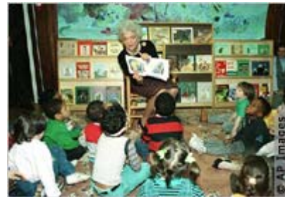
La primera dama Barbara Bush lee un cuento a preescolares en Nueva York, en 1990

El presidente Franklin Roosevelt, esposo de Eleanor Roosevelt, padecía la enfermedad de polio que le impedía caminar y limitaba su libertad de movimiento para inspeccionar las diversas condiciones que imperaban en el país. La señora Roosevelt asumió esta importante función que para ella era equivalente a ser los "ojos y oídos" de su esposo. Además de sus responsabilidades como primera dama, Eleanor Roosevelt redactaba una columna mensual para una revista y otra diaria para un periódico, dictaba conferencias, era anfitriona de un