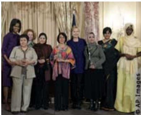
La primera dama Michelle Obama y la secretaria de Estado Hillary R. Clinton con las premiadas del Certamen Mujeres de Coraje 2009.