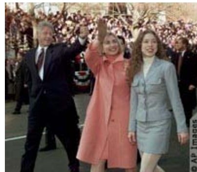
La segunda toma de posesión del presidente Clinton fue la primera transmitida por Internet.

Lyndon Johnson, 22 de noviembre de 1963. Primer juramento que se administra en un avión (Air Force One, en la ciudad de Dallas, posteriormente al asesinato del presidente Kennedy); primer juramento administrado por una mujer (Sarah Hughes, jueza de Distrito de Estados Unidos).