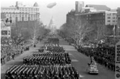
La toma de posesión del presidente Truman fue la primera transmitida por televisión.

Primera toma de posesión grabada por una cámara de película cinematográfica.